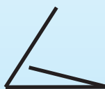
standardní dopisní sklad